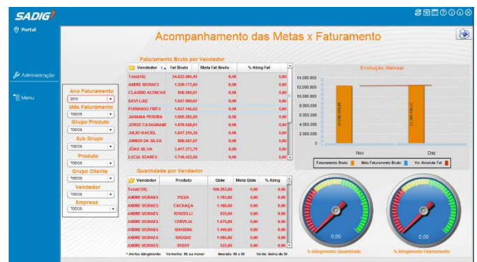
Exemplo de painel

A visualização dos painéis desenvolvidos pode ser feita em ambiente Windows, Web e Tablets.