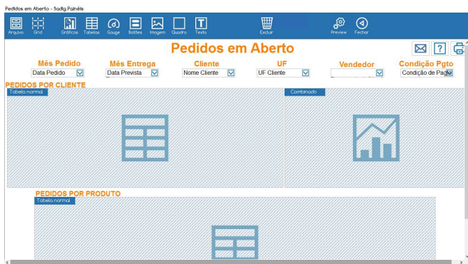
Ambiente de "Design"

Podem ser desenvolvidos sob medida para cada necessidade, a partir de um ambiente integrado de "design", fácil de aprender e usar.